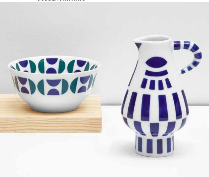
CHIC BLUE. La gallega Sargadelos apunta alto en sus colaboraciones y nuevas colecciones. Esta vez, se ha aliado nada menos que con Jasper Morrison: Bol AB1, en porcelana (6,3 cm; 17€). La jarra es Paxariforme N° 1, obra del departamento de diseño de Sargadelos (13,8cm; 24€).