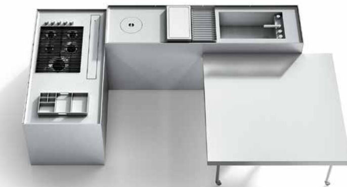
LA COCINA DE TUS SUEÑOS. Las nuevas cocinas recuperan su lugar como corazón de la casa, convirtiéndose en espacios en los que compartir y estar en buena compañía. Esta de la imagen, Combine, es una propuesta de Boffi de magnífico acabado e inmejorable diseño. Una creación de Piero Lissoni.