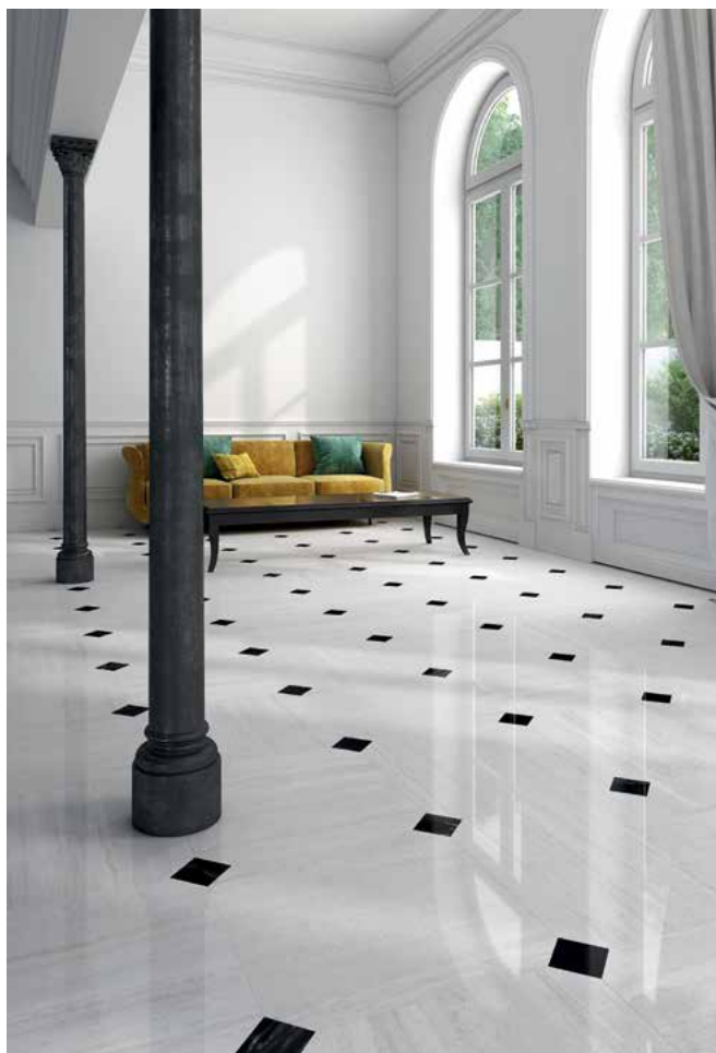
LOCURA EN DAMERO. El efecto damero nunca pasa de moda, ideal para espacios de grandes proporciones, siempre logra un look de alta gama, incluso si no es de mármol (a la antigua usanza). Este es de Devon & Devon : Atelier 18 (gres porcelánico; 60 x 60 cm y 10 mm de grosor; 240€/m 2 ).