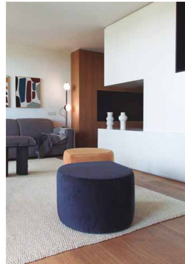
FOTOGRAFÍAS: YLAB ARQUITECTOS BARCELONA. TEXTOS: PABLO ESTELA.

Los propietarios, una pareja enamorada de Barcelona, quisieron reformar este apartamento para disfrutar de la cercanía al mar y la tranquilidad de esta parte de la ciudad. Querían convertir esta vivienda de dos habitaciones en un espacio confortable y funcional de un solo dormitorio, donde los ambientes principales se conectan y se abren a la terraza exterior mediante un espectacular ventanal con vistas sobre el parque y el mar. Para ello, se propone una redistribución completa de la vivienda original, dando prioridad al espacio común central formado por la cocina y el salón, que se alinea con el dormitorio suite a lo largo del ventanal, para el máximo aprovechamiento del panorama y la luz.