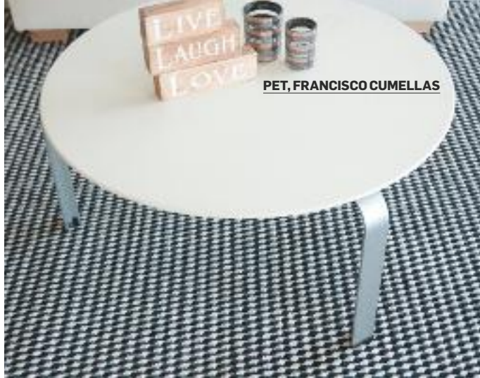
PET, FRANCISCO CUMELLAS