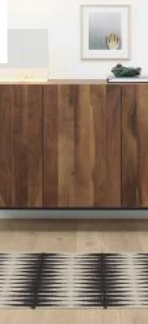
NEYRIZ, PHILIPP MAINZER PARA E15

El kilim es una alfombra sin pelo ni nudos, tejida a mano con lana. Nació hace unos 3.500 años en Asia Central, desde donde se fue extendiendo hacia Europa Oriental y África del Norte. Recibe diferentes nombres según su país de procedencia: dhurrie en la India, kilim en Turquía, gelim en Irán. Son consideradas las alfombras más antiguas del mundo y se caracterizan por sus dibujos geométricos con colores vivos obtenidos gracias a tinturas naturales. En su manufacturación se forma una nueva tira en la alfombra cuando cambia el color. Por eso la palabra kilim significa "que no mezcla colores". No los mezcla, pero acepta multitud de combinaciones, lo que le convierte en una fuente de color que aporta calidez y vivacidad en cualquier estancia. Diseñadores y fabricantes unen esfuerzos para crear nuevos kilims que se adapten a los nuevos tiempos, sin perder la magia de su valor artesanal: cambian los dibujos, se introducen nuevos colores, pero su esencia se mantiene. Ronan y Erwan Bouroullec han reinterpretado el kilim para nanimarquina con la colección Losanges. Su confección requiere de una gran destreza por parte de los artesanos del norte de Pakistán que la producen ya que se trata de combinar 13 colores a ▶