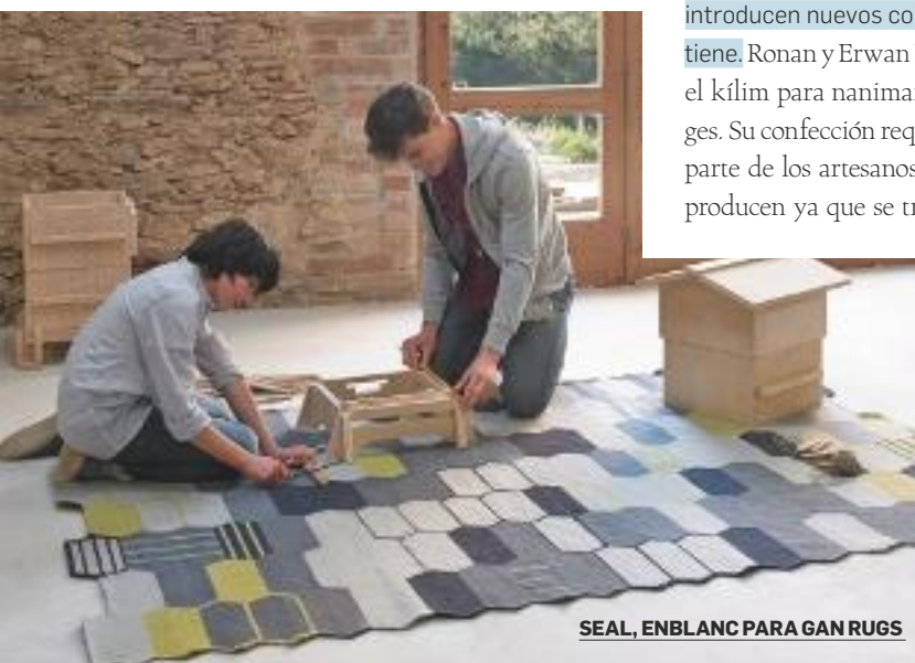
SEAL, ENBLANC PARA GAN RUGS