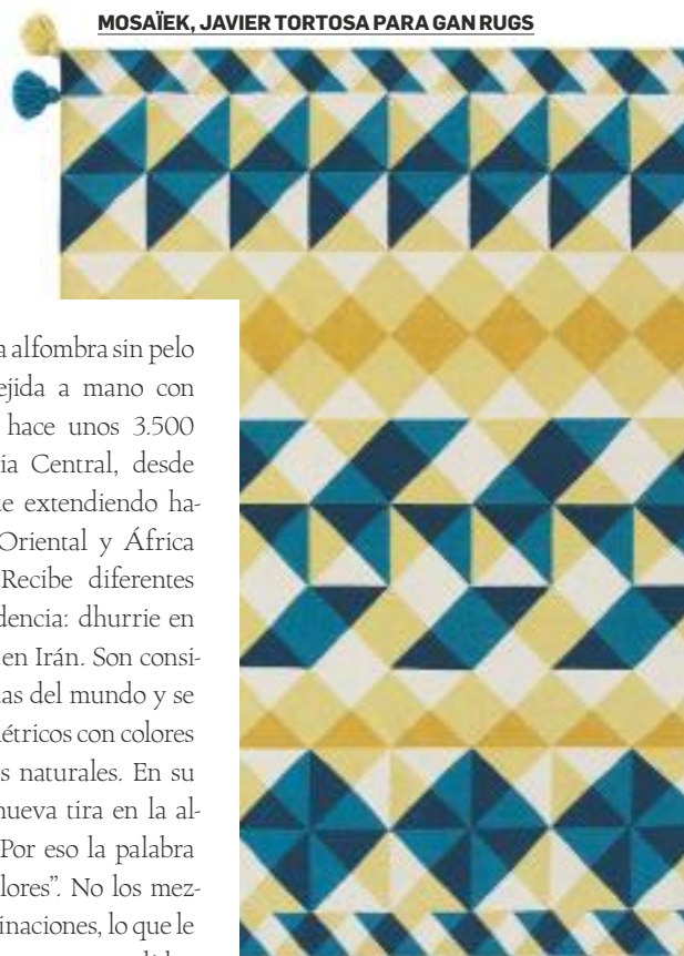
MOSAÏEK, JAVIER TORTOSA PARA GAN RUGS